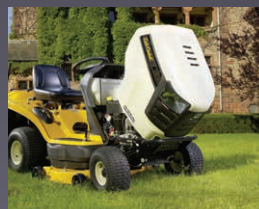
CAPOT MONOBLOC PIVOTANT