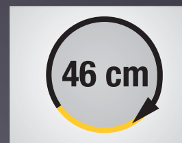
RAYON DE BRAQUAGE COURT