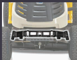
TRAIN AVANT PIVOTANT