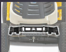
TRAIN AVANT PIVOTANT EN FONTE