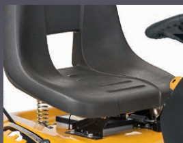
SIÈGE HAUT AJUSTABLE